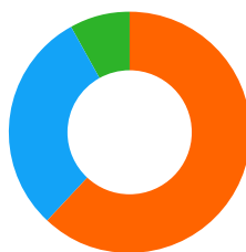
Ingresos por Región